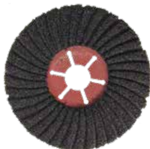
Carbone de silicium - Bombé