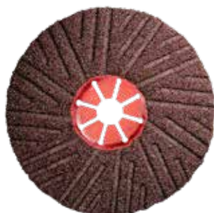
Corindon - Bombé