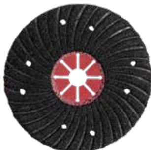
Carbone de silicium - Plat