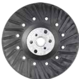
Plateau à écrou M14