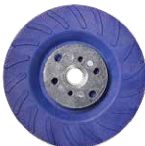
Plateau ventilé bleu à écrou M14