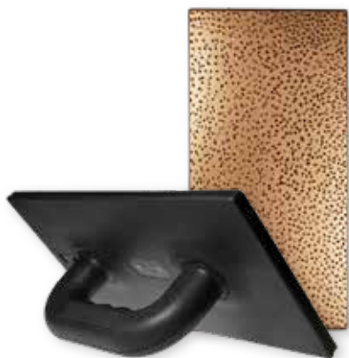
Taloché magnétique (polypropylène haute résistance avec aimants intégrés) + garniture magnétique 280 x 140 mm