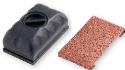
Cale sabot (polypropylène haute résistance) + garniture 100 x 60 mm