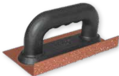
Taloché renvoi d'angle 200 x 100 mm